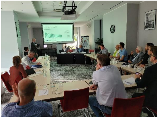
Teilnehmer-Briefing am 10.06.2024