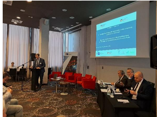
Präsentationsveranstaltung am 11.06.2024 / Eröffnung