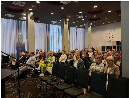
Präsentationsveranstaltung am 11.06.2024