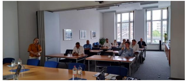
Impressionen einer von SBS organisierten Informationsveranstaltung in Hamburg

Eine Übersicht zu weiteren Projekten des Markterschließungsprogramms für KMU des Bundesministeriums für Wirtschaft und Klimaschutz können Sie unter www.gtai.de/mep abrufen.