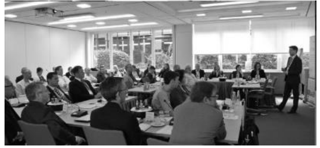
Impressionen einer von SBS organisierten Informationsveranstaltung in Berlin

Tel: 030 220133-96 – E-Mail: k.hohdorf@sbs-business.com